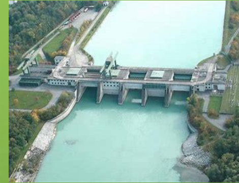
~7.300 Anlagen 5,5 GW