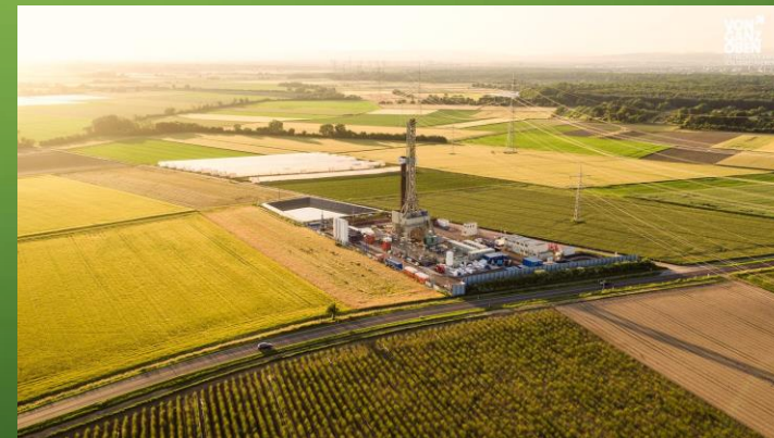
42 Anlagen 0,05 GW