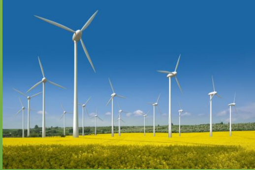
28.667 Anlagen /61,01 GW