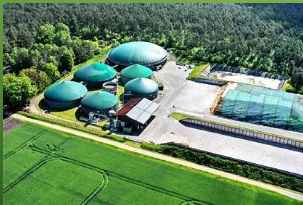
~9.900 Anlagen 5,9 GW