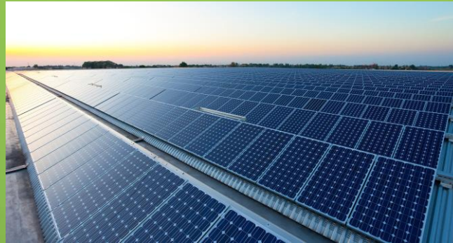
3,7Mio Anlagen 81,7 GW